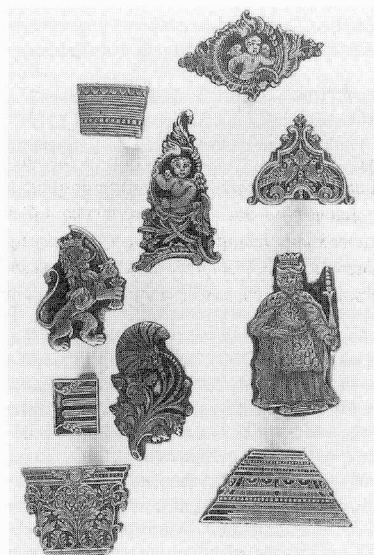
Stempelmateriaal van de Amsterdamse 'Van Damme binderij', ca. 1747 – 1786 (collectie KB Den Haag); afgebeeld in STORM VAN LEEUWEN.

Red. Jos.M.M. Hermans [+31]50 3636114, fax: 3637263, j.m.m.hermans@rug.nl , L.S.Wierda, lswierda@home.nl en W.C.M.Wüstefeld, wwustefeld@zonnet.nl .