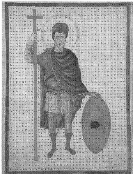
Handschrift Rabanus Maurus, 'De Laude Crucis' met afb. Lodewijk de Vrome. Fulda, 825/6, (Biblioteca Apostolica Vaticana, Reg. Lat. 124, 4v), te zien in MAINZ.